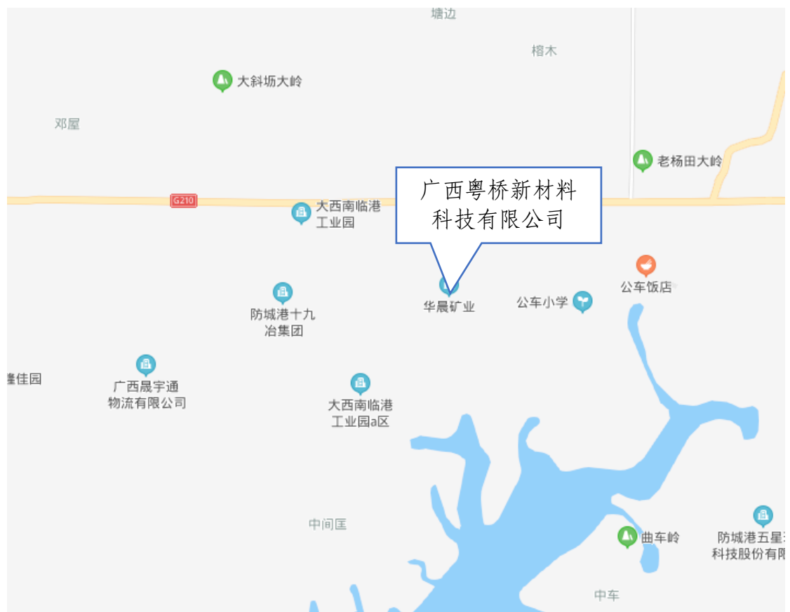
图1 广西粤桥新材料科技有限公司地理位置